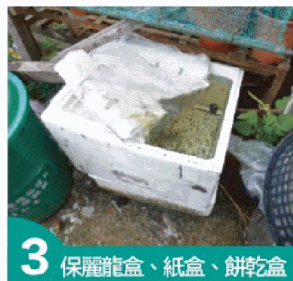
3 保麗龍盒、紙盒、餅乾盒