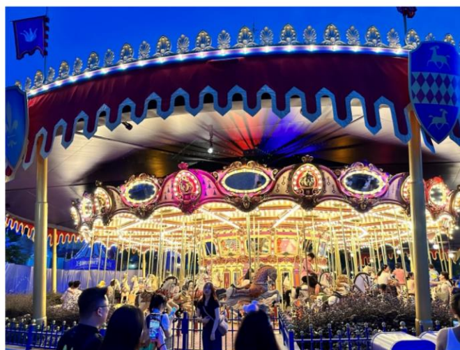
※2023 年 前進香港迪士尼