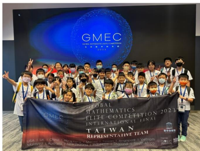
※2023 年 台灣代表隊