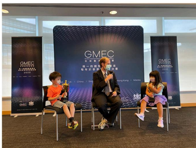
※2020 年 與教授的一席話

2. AoPS 遊學團獎金：全球冠軍將獲得參加 AoPS 遊學團的全額獎學金。（僅包含課程）