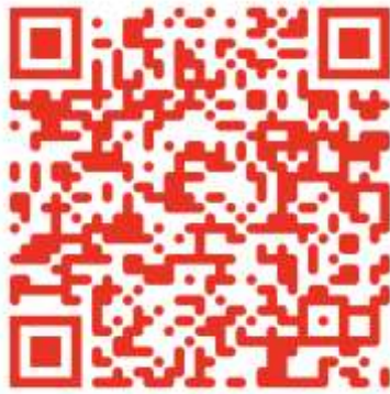
(報名網站 QR Code)

三、報名網站： 『https://www.synergy.tw/events.php』 網站，請領隊(1個人即可)代表團隊先加入會員，才能進後台，隨時更正團員、同意書、上傳影片資料。